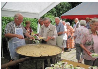
Vereinstreff mit Pfanne