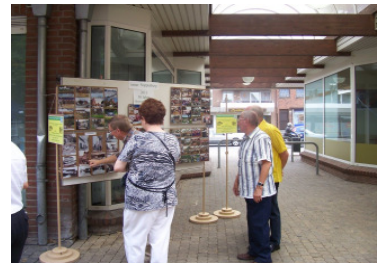
60 Jahre Gewerbeverein Merkstein